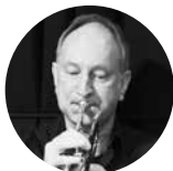
Musikalische Co-Leitung: Daniel Schenker