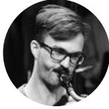
Tobias Pfister tenor