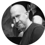
Musikalische Leitung: Ed Partyka