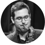
Toni Bechtold tenor